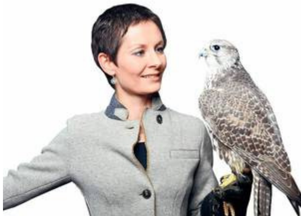
Auf Augenhöhe. Auch Seminare mit Greifvögeln gibt es