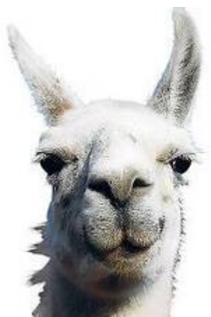
Gelassen. Lamas bleiben zunächst auf Distanz, sind aber dennoch neugierig. Wanderungen mit ihnen sollen innere Ruhe bringen.